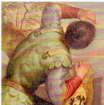
GALLERIA NAZIONALE DELLE MARCHE